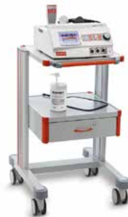
Apparecchiature INDIBA® activ

SOLUZIONE EFFICACE PER: Rafforzare le strutture pelviche Migliorare la loro idratazione Rafforzare le fibre di sostegno